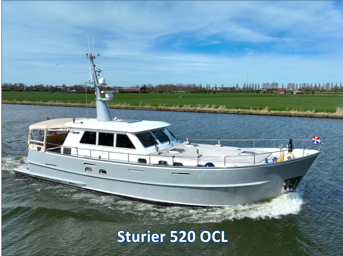
Sturier 520 OCL